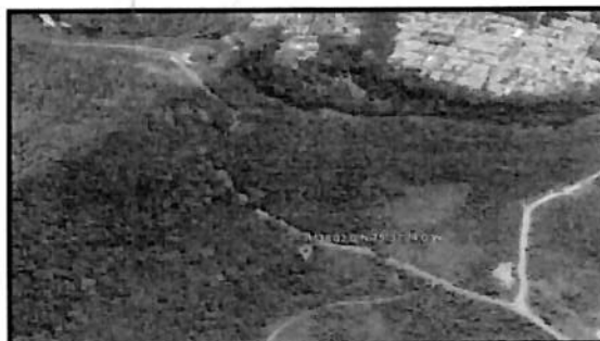
Figura 1: área de afectación por tala de árboles

El área afectada se ubica en la vereda Vereda Bajo caldas, sector trocal del hacha, en el municipio de Florencia (Caquetá).