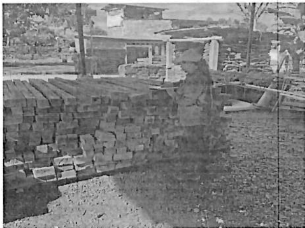
imagen 1 y 2 Productos forestales objeto de aprehensión preventiva.