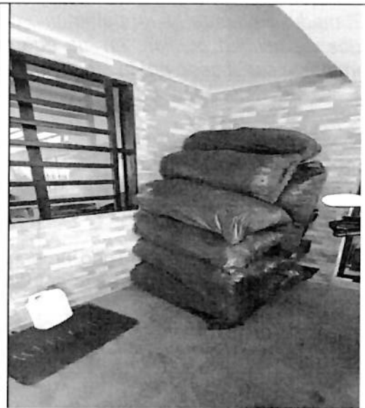
Imagen 2. descargados en las instalaciones de la Dirección Territorial Caquetá, Unidad Operativa Rio Caguán San Vicente del Caguán.