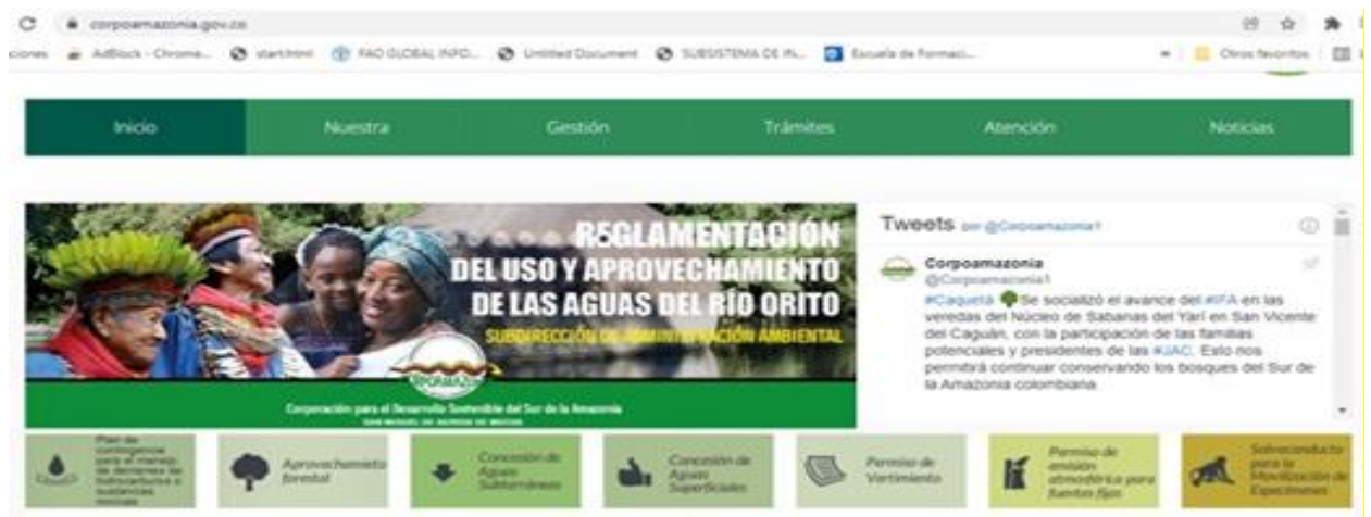
Figura No.1. Publicación de la Reglamentación de usos y aprovechamiento de las aguas del rio Orito en la Pag Web

del 2021 hasta el 08 de enero de 2022, en la pag Web de la entidad (fig No. 1) y fue compartido en la red social Facebook: https://www.facebook.com/Corpoamazonia/photos/a.920053008036985/6718881634820731/ , con el fin objetivo de recibir aportes o comentarios mediante comunicación escrita al correo institucional correspondencia@corpoamazonia.gov.co hasta el día 28 de enero del año 2022, como lo estipula el artículo 2.2.3.2.13.5 del Decreto 1076 de 2015.