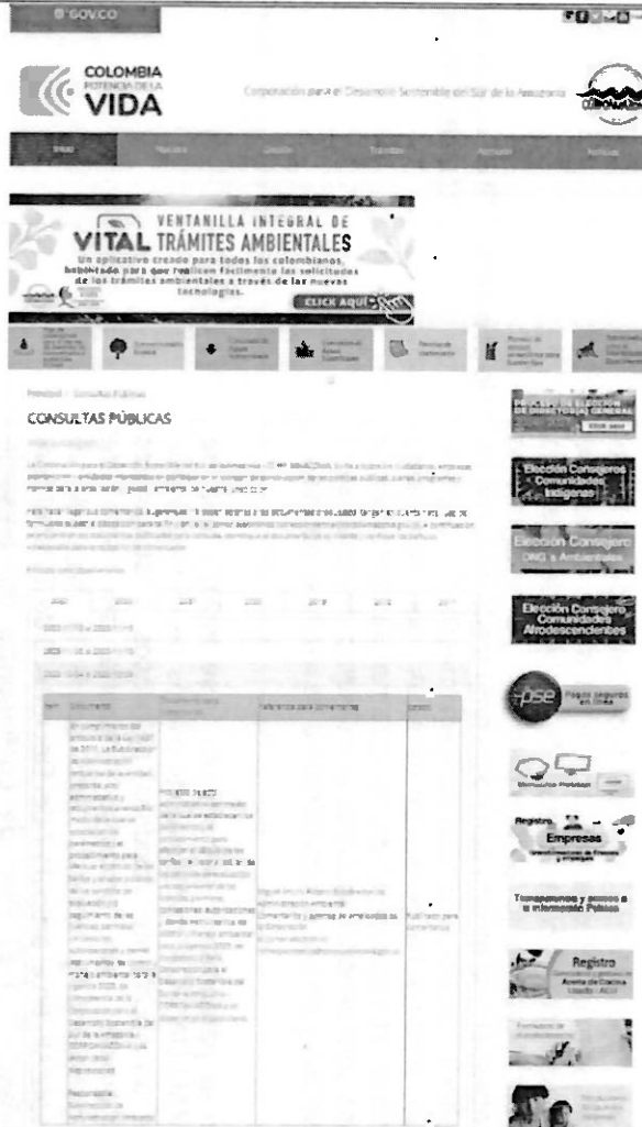
Imagen 1. Publicación del Proyecto de acto administrativo en la página de Corpoamazonia.

Que, una vez revisado el correo institucional y la oficina central de correspondencia, con fecha de cierre de la convocatoria, se deja constancia que se presentaron los siguientes comentarios con relación al documento publicado y que fueron revisados con el equipo técnico en la semana del 16 al 20 de octubre de 2023 ( Anexo 1 ). A continuación, se presenta la respuesta a los comentarios recibidos.