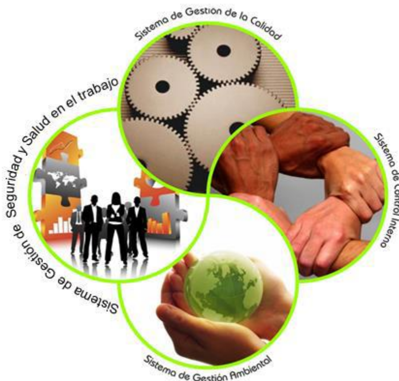
Gráfico 3. Modelo de Gestión SIGE

calidad, los administrativos y los de seguridad industrial y salud ocupacional, y, la satisfacción de los usuarios, en términos de una mejor prestación de los servicios que responda a un desarrollo sostenible integral, a través de proceso continuo de evaluación y mejoramiento.